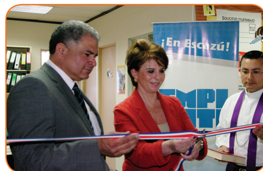
Sandra Pizsk, Ministra de Trabajo, y Arnoldo Barahona, Alcalde de Escazú, cortan la cinta que inaugura la oficina EMPLEATE de Escazú.

“Nos sentimos realmente complacidos y entusiastas abriendo una nueva ventanilla EMPLEATE. Además, esta primera acreditación permite instalar una serie de conocimientos sobre las competencias laborales (sociales y personales) que deberán