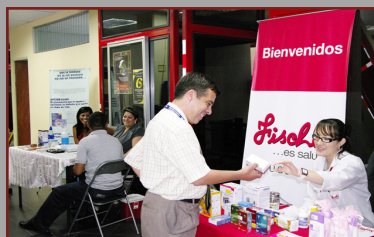
Funcionarios del Ministerio de Trabajo consultan en los diferentes stands de la Feria.

En el marco de la semana de la salud, en el Ministerio de Trabajo y Seguridad Social se realiza una serie de