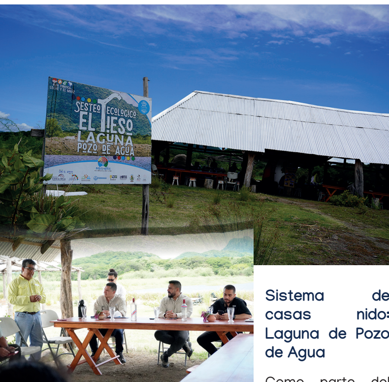
Sistema de casas nido: Laguna de Pozo de Agua

El proyecto está en fase de planificación e iniciará su construcción en octubre de este año.