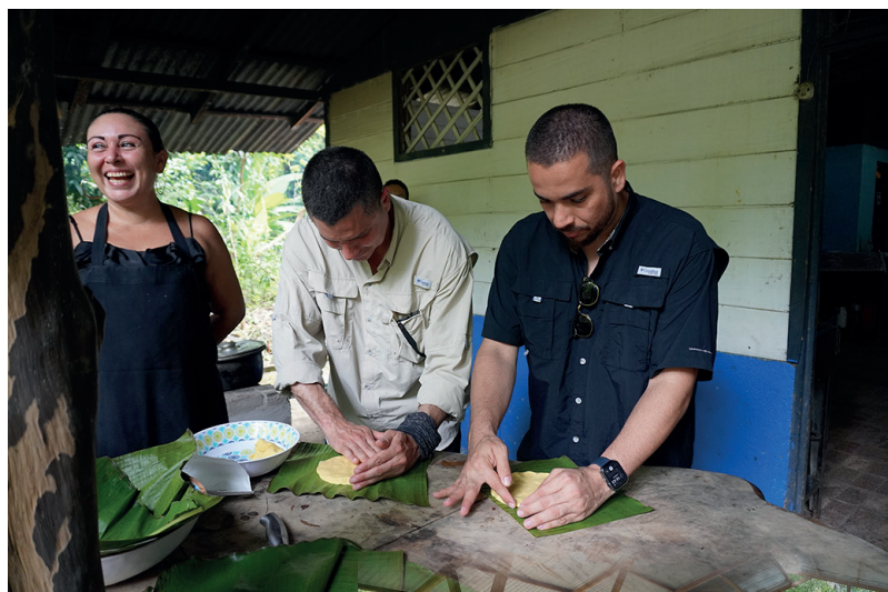
EcoParque del Agua: Formación y Recreación Cultural

La inversión total desde el Programa Nacional de Apoyo a la Microempresa y la Movilidad Social, PRONAMYPE, es de ¢25 millones y beneficiará a 15 personas de la comunidad.